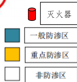
图 4-1 环境应急资源分布图（一期）